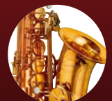
ゴールドプレート