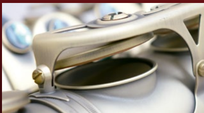
〈通常のトーンホール〉