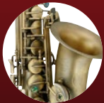
ダークヴァインテージ