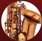
コニャックラッカー