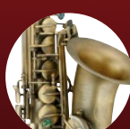
ダークヴィンテージ