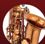
コニャックラッカー