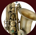
ダークヴィンテージ