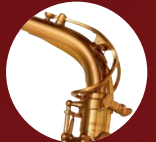
ゴールドブラス ネック