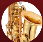
ゴールドラッカー

管 体：イエローブラス 仕 上：ゴールドラッカー、ダークヴィンテージラッカー、アンラッカー ベ ル：ラージベル ボア(管体サイズ)：ラージボア