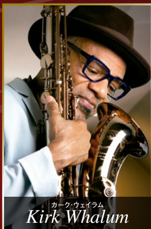
カーク・ウェイラム Kirk Whalum

私が初めてP.モーリアの楽器に息を吹き込んだ時、求めていた息のスピード感 を感じました。さらにそこから広がる倍音豊かな音色。衝撃的な出会いで、即この メーカーの楽器に惚れ込みました。息のコントロールがしやすいので表現力も 付きやすく、私の生徒さん達もこの楽器に変えた途端、急激に上手くなりました。 全くストレスのない楽器は、はじめての出会いでした。息の入りやすさだけで なく、両手のサイズ感がとても良く、持ちやすい。 もちろん見た目も!まるで宝石みたい!最高のサクセスです!