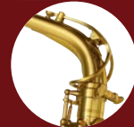
イエローブラス ネック

管 体：イエローブラス 仕 上：ゴールドラッカー ネ ッ ク：イエローブラス製Super VIネック、 ゴールドブラス製Super VIネック パ ッ ド：メタルブースター サムレスト/フック：イエローブラス製サムレスト/フック